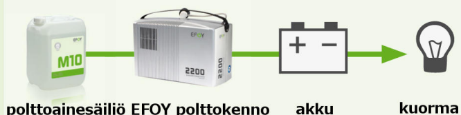
EFOY polttokenno + akku